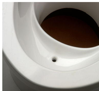
Trennung von Urin und Fäzes

Toilettenwagen: 4 m Länge x 2,4 m Breite Ausstattung für Damen: 2 Trocken-Trenn-Toiletten (TTC) Ausstattung für Herren: 1 TTC und 2 wasserlose Urinale