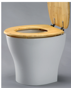
Toilettenstuhl aus Mineralguss